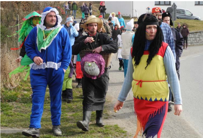
Letošní masopustní průvod vyšel na jedničku. Páralo mu počasí, masky i navštívené domácnosti se bavily. Vše završila večerní tancovačka.

Z a finanční podpory Jaderné elektrárny Temelín v rámci Oranžového roku 2014 uspořádala v březnu obec společně s hasiči masopustní rej.