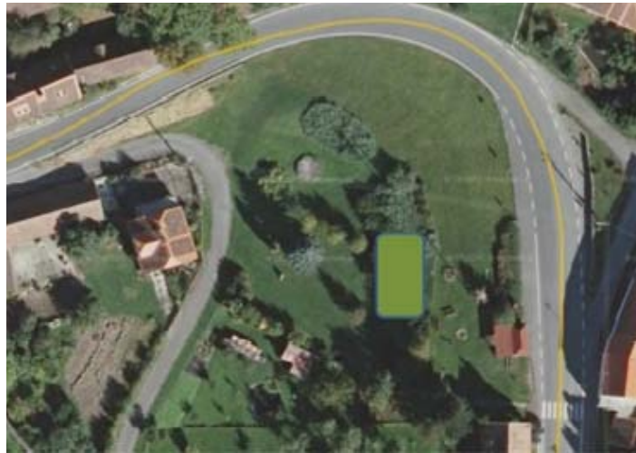
Zelená plocha ukazuje, kde by nové hřiště mělo na pasecké návsi být.

Přestože zápis ze zastupitelstva sám o sobě dost vypovídá, dovoluji si tímto přidat pár mých připomínek a postřehů. Plně chápu občany, že se jim nelíbí, že se zastupitelé (na veřej-