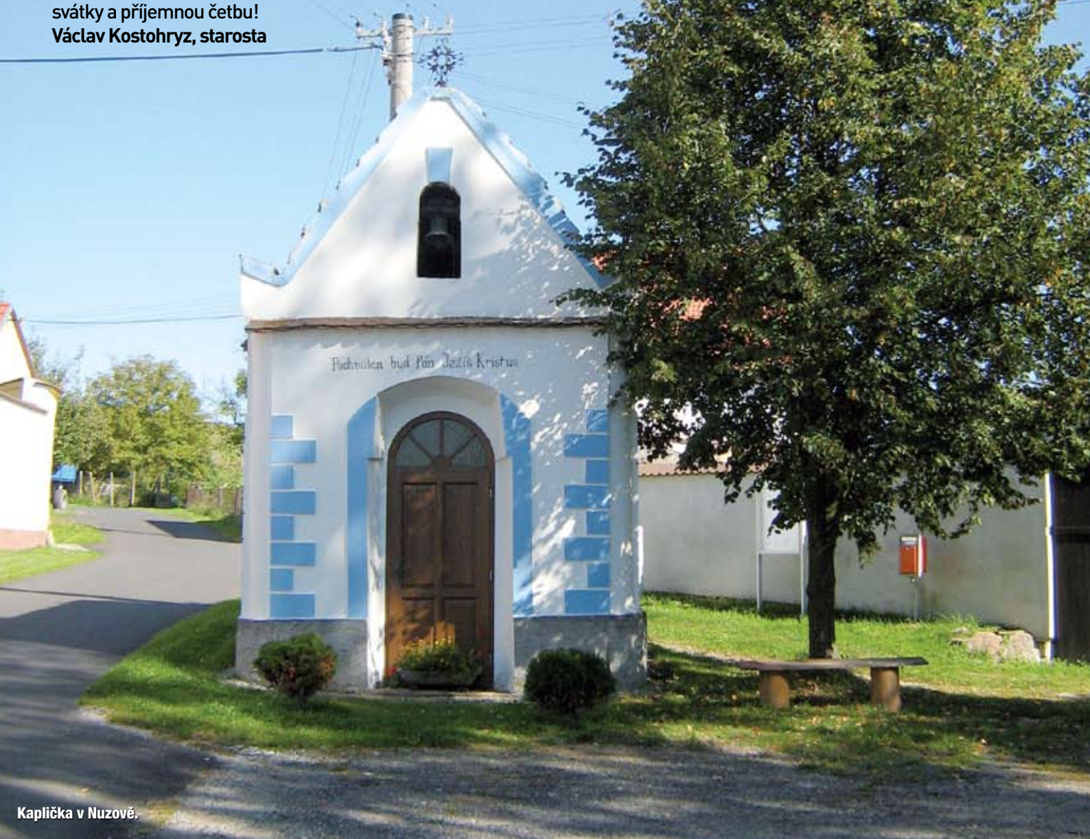
Kaplička v Nuzově.